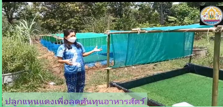
ปลูกแทนแดงเพื่อลดต้นทุนอาหารสัตว์