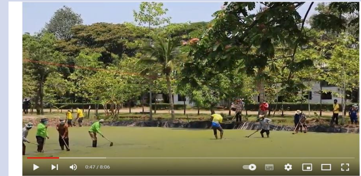
เห็ดเกล็ดทองเมืองสกล แก้วคนคนสกลนคร สำนักงานปศุสัตว์ จังหวัดสกลนคร ผู้ติดตาม 91 คน