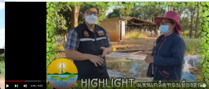
เห็ดเกล็ดทองเมืองสกล อ.เจริญศิลป์ จ.สกลนคร VetChamp ผู้ติดตาม 2.55 พัน คน