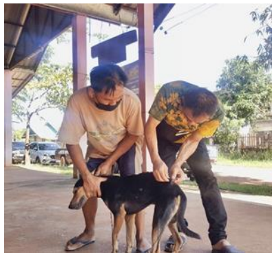
ด้านปศุสัตว์ เช่น อาสาปศุสัตว์ การทำวัคซีนสัตว์เลี้ยงในหมู่บ้าน การป้องกันโรคระบาดสัตว์ในหมู่บ้าน