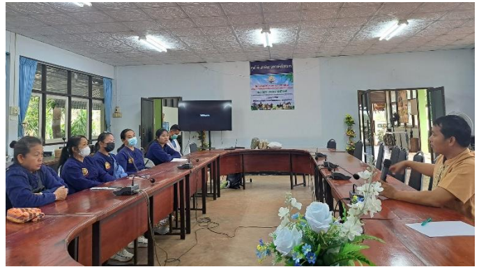
อบรมเชิงปฏิบัติการหลักสูตร “พัฒนาองค์ความรู้เจ้าหน้าที่ส่งเสริมการทำสุสตรว์อินทรีย์” ระหว่างวันที่ 25 – 26 มกราคม 2567 ณ ศูนย์วิจัยและพัฒนาอาหารสัตว์สกลนคร

1.3. เกษตรกรต้นแบบการปฏิบัติและบริหารวิสาหกิจที่ดี ได้รับการสนับสนุนการจัดฝึกอบรมและสนับสนุนปัจจัยการผลิตทางการเกษตรจากหน่วยงานราชการในพื้นที่จังหวัดสกลนคร