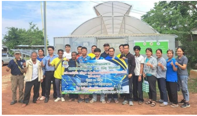
อบรมโครงการพัฒนาทักษะเฉพาะของแรงงานอิสระ ( Gig Worker ) หลักสูตร "การติดตั้งและบำรุงรักษา เซลล์แสงอาทิตย์" รับผิดชอบจ่ายการผลิต ณ ศูนย์เรียนรู้โรงเรียนเกษตรแม่นยำปลอดภัยฯ วิสาหกิจชุมชน เกษตรผสมผสานบ้านโคกเกาะ ต.ขมิ้น ในวันที่ 26 มิ.ย 67 สำนักงานพัฒนาฝีมือแรงงานจังหวัดสกลนคร กรมพัฒนาฝีมือแรงงาน กระทรวงแรงงาน