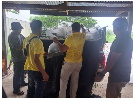
มอบปัจจัยการผลิตให้กับเกษตรกรภายใต้โครงการเกษตรกรรมยั่งยืน ปี 2567 สำนักงานประมงจังหวัดสกลนครและสำนักงานประมงอำเภอเมืองสกลนคร