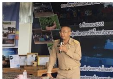
อบรมการเลี้ยงเห่านเกล็ดทองเมืองสกล เพื่อผลิตอาหารสัตว์ลดต้นทุน