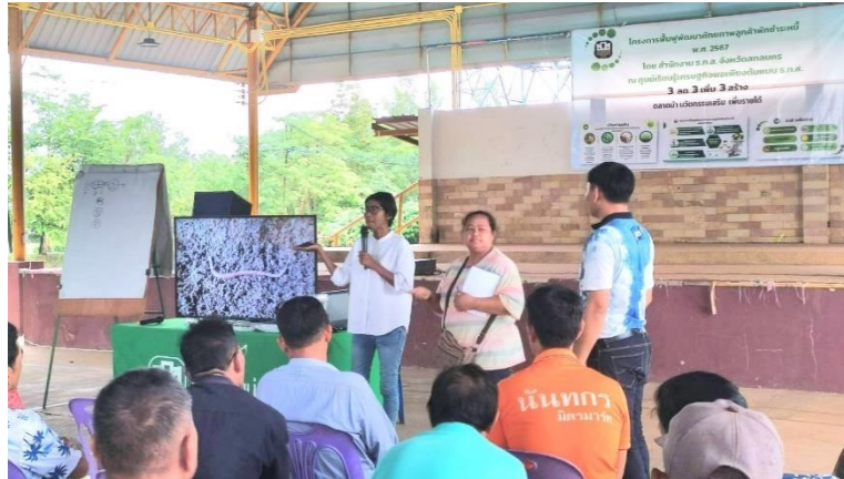
เป็นวิทยากรในการฝึกอบรมโครงการฟื้นฟูพัฒนาศักยภาพลูกค้าพักชำระหนี้ ตามนโยบายของรัฐบาลปี ๒๕๖๗