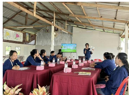
เป็นวิทยากรโครงการศูนย์เรียนรู้การเพิ่มประสิทธิภาพการผลิตสินค้าเกษตร พ.ศ. 2567 สำนักงานปศุสัตว์อำเภอเมืองสกลนคร จังหวัดสกลนคร