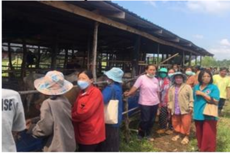
อบรมด้านการเลี้ยงโค