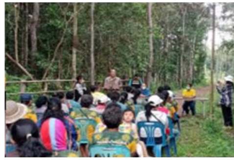
อบรมโครงการการผลิตพืชและการดูแล พืชอาหารสัตว์