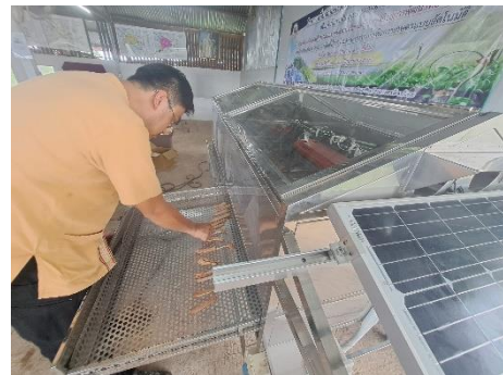
อบรมหลักสูตรการติดตั้งโซล่าเซลล์และระบบน้ำเพื่อการเกษตรแบบอัตโนมัติ รุ่นที่1/2567 สำนักงานพัฒนาฝีมือแรงงานสกลนคร