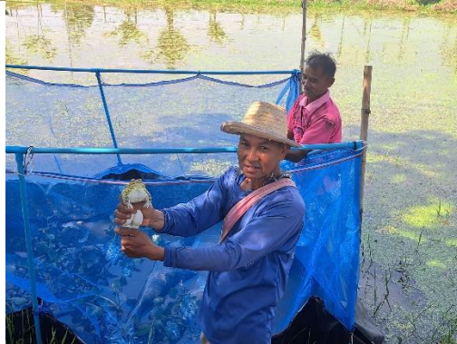
แหล่งเรียนรู้การเลี้ยงกบ