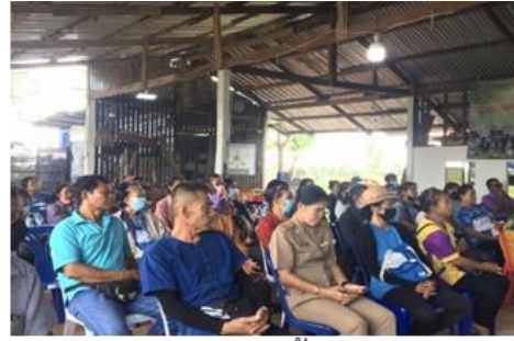
อบรมโครงการการเลี้ยงไก่เหล็องดงขอ เพื่อสุขภาพ