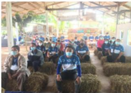
อบรมโครงการ โคก หนอง นา โมเดล